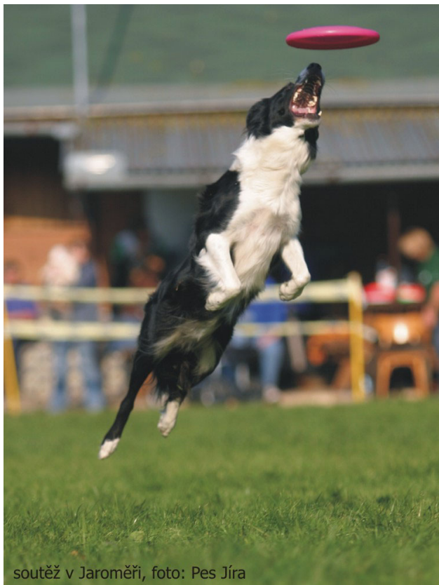
soutěž v Jaroměři